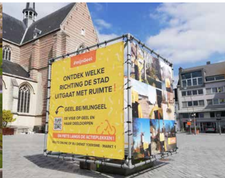
Dankzij een doorgedreven participatietraject is Geel de koploper in de beleidsplanningsprocedure.